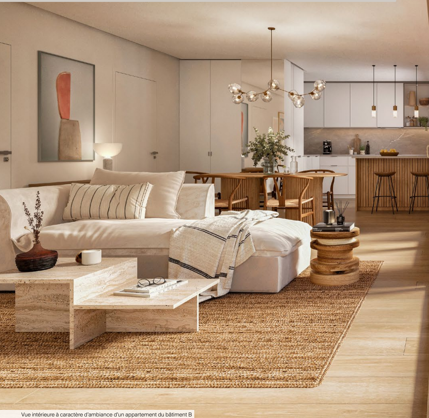
Vue intérieure à caractère d'ambiance d'un appartement du bâtiment B

Les Ateliers Beaumarchais proposent des appartements évolutifs qui se déclinent en différentes typologies allant du studio au 5 pièces duplex pour répondre à tous vos projets.