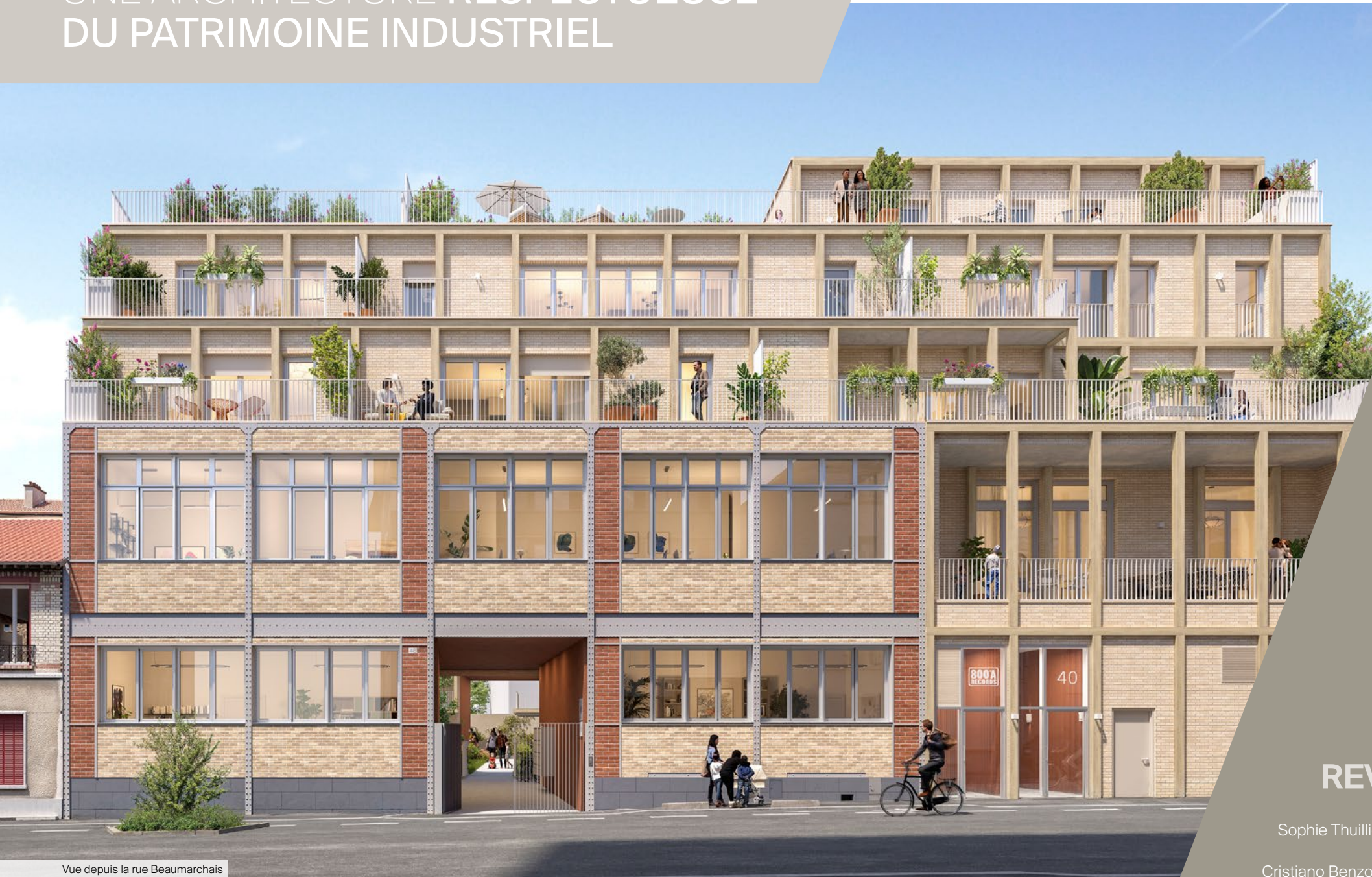
Vue depuis la rue Beaumarchais

Les architectes de l'agence REV ont su préserver le caractère industriel du bâtiment, qui autrefois abritait les ateliers textiles SCHOTT, à travers sa réhabilitation, son extension et sa surélévation. Les façades se distinguent par une série d'éléments de modénature en bois, ponctués par de larges baies vitrées. Des matériaux sobres et élégants , comme la brique et le bois , ont été choisis avec soin afin de s'intégrer subtilement dans un tissu urbain varié.