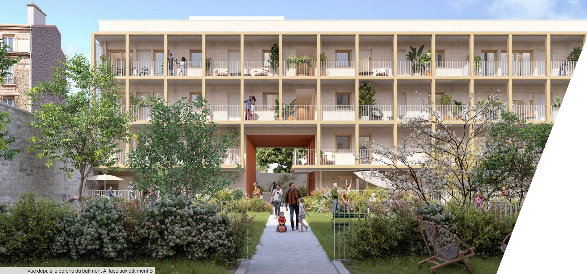
Vue depuis le porche du bâtiment A, face aux bâtiment B

Une fois le porche du bâtiment A traversé depuis la rue, le cœur d'îlot s'offre aux résidents comme une véritable oasis en ville.