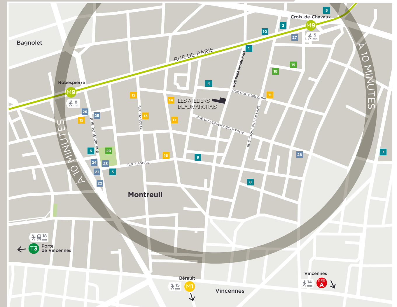
Figure emblématique du Grand Paris, la ville de Montreuil se distingue par une identité marquée par un héritage industriel et social . Dès les années 1960, la ville est investie par des artistes et des urbains en quête d'espace et de tranquillité. Les anciennes usines sont transformées en ateliers, les arrières-cours en cafés et en commerces éco-solidaires.

La proximité du Bois de Vincennes et la qualité de sa desserte font de Montreuil une ville attirante pour les familles et les jeunes actifs.